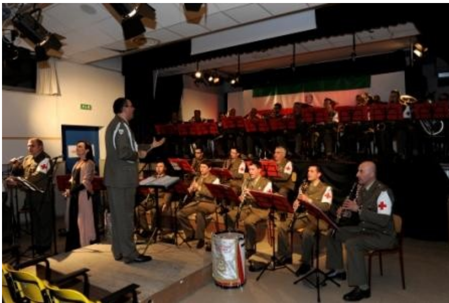
Foto 3 Il Concerto all'Auditorium della Banda Musicale della Croce Rossa